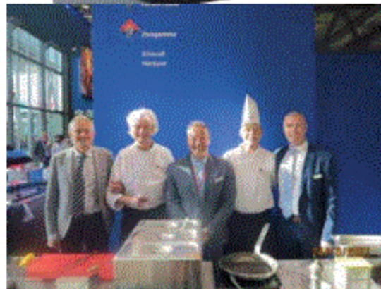
A TUTTOFOOD non poteva mancare il Gruppo olandese VanDrie, Leader mondiale nelle Carni di Vitello. I visitatori hanno potuto assaggiare la qualità delle Carni con i piatti preparati dagli Chefs presenti durante la manifestazione

"La collaborazione tra Fiera Milano e Informa Markets – prosegue Palermo – prende avvio dai settori Food & Hospitality, dove siamo leader a livello internazionale, per poi proseguire in altri settori. Siamo certi che questa alleanza possa rappresentare un'ulteriore opportunità di internazionalizzazione da offrire alle aziende che partecipano alle fiere. La nostra ambizione rimane invariata: vogliamo rafforzarcì come hub europeo in grado di ospitare congressi e manifestazioni di respiro mondiale. Per questo siamo sempre più concentrati ad attivare partnership con grandi attori internazionali". Con questa edizione HostMilano e TUTTOFOOD si sono confermate come piattaforme non solo di business, ma anche di presentazione di dati e ricerche, condivisione di conoscenze, competizioni internazionali e scoperta di nuove tendenze: centinaia gli eventi in programma. ■