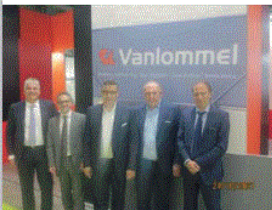
Il Gruppo VanLommel, società belga specializzata nelle forniture di Carne di Vitello di alta qualità. Totale controllo della filiera per garantire massima freschezza e sicurezza delle Carni