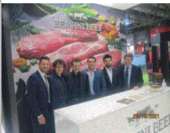
Nello stand del Gruppo Bervini un profumo di Arte, Storia e Prodotti gastronomici di grande qualità. Dai migliori pascoli del mondo le migliori carni scelte per una clientela di primo piano. Carni pregiate che portano con se la storia e la cultura rurale dei paesi produttori