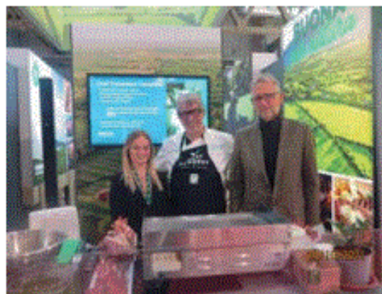
Bord Bia, presente a TUTTOFOOD Milano per promuovere l’alta qualità delle Carni Irlandesi