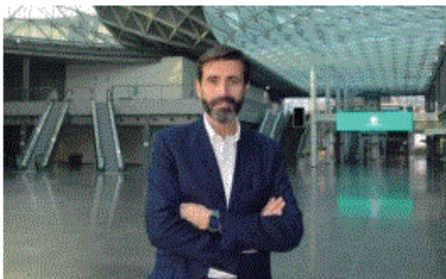
Luca Palermo, CEO Fiera Milano

ccio di filiera che occorre all’ecosistema italiano dell’agroalimentare e dell’ospitalità e fuoricasa per presentarsi all’estero in maniera organica”.