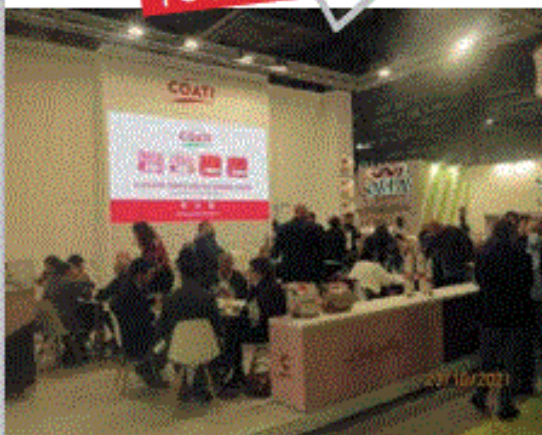
"Il giusto tempo per un sapore unico". Il salumificio Coati parte dalle tradizioni e dalle materie prime per sviluppare prodotti salumieri di alta qualità

"La collaborazione tra Fiera Milano e Informa Markets – prosegue Palermo – prende avvio dai settori Food & Hospitality, dove siamo leader a livello internazionale, per poi proseguire in altri settori. Siamo certi che questa alleanza possa rappresentare un'ulteriore opportunità di internazionalizzazione da offrire alle aziende che partecipano alle fiere. La nostra ambizione rimane invariata: vogliamo rafforzarcì come hub europeo in grado di ospitare congressi e manifestazioni di respiro mondiale. Per questo siamo sempre più concentrati ad attivare partnership con grandi attori internazionali". Con questa edizione HostMilano e TUTTOFOOD si sono confermate come piattaforme non solo di business, ma anche di presentazione di dati e ricerche, condivisione di conoscenze, competizioni internazionali e scoperta di nuove tendenze: centinaia gli eventi in programma. ■