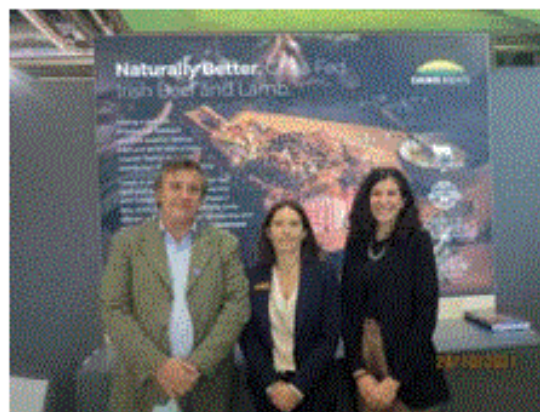
Irish Beef and Lamb, Naturally Better: La Dawn Meats presente a Tuttofood Milano con l'alta qualità delle Carni Irlandesi